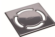
Grille (115 x 115 mm)